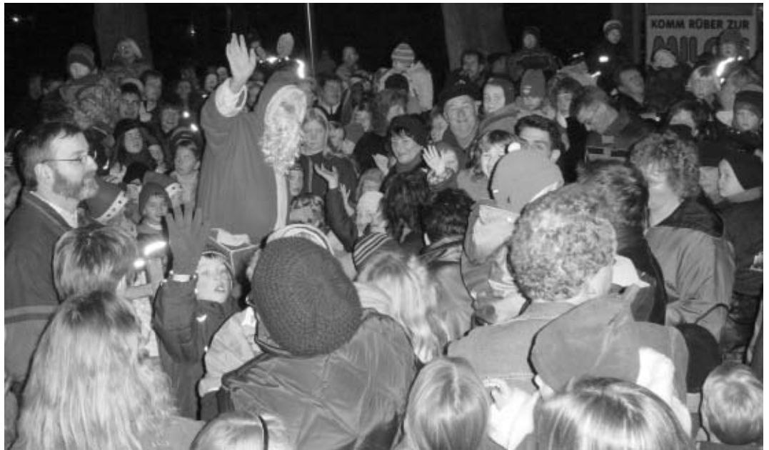
Gruppenbild mit Nikolaus. Für ihn gab es kaum ein Durchkommen. Schließlich warteten 300 Kinder...

Eine Verlosung rundete die gelungene Veranstaltung ab.