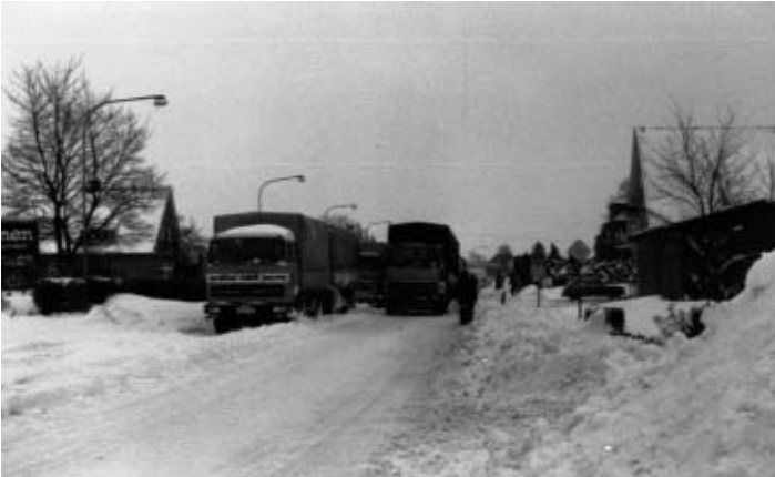
Remels, Ostertorstraße/Ecke Bismarckstr.