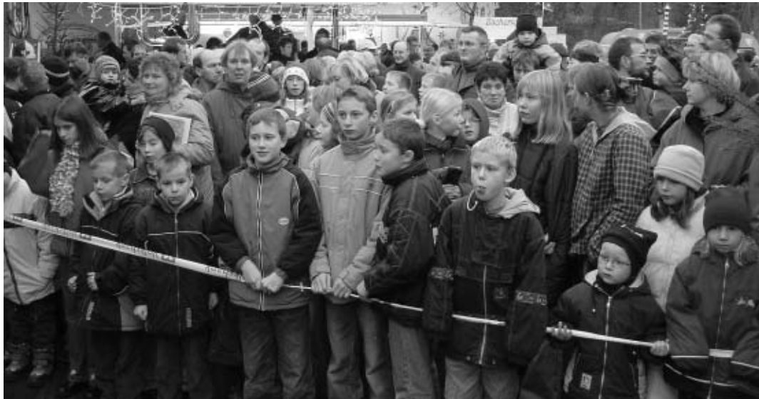
Die Kinder erwarteten geduldig ihren Star des Tages: Der Nikolaus hatte viele leckere Stutenkerls im Schlepptau, die reißenden Absatz fanden.

Nikolaus verteilte Stutenkerls an die Kinder / Verlosung zu Gunsten der Diakoniestation Remels