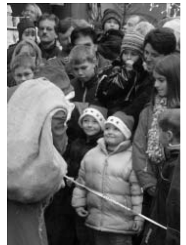
Gehörigen Respekt zeigten einige kleinere Kinder, als sie dem Nikolaus gegenüber standen.

wertvolle Preise, unter anderem Fahrräder, zu gewinnen. Der Reinerlös in Höhe von 350 Euro wurde der Diakoniestation in Remels gespendet. Der Nikolaus kam mit etwas Verspätung. Wahrscheinlich lag es an der geschlossenen Wolkendecke... Aber die Kinder warteten geduldig und alle erhielten ihren obligatorischen Stutenkerl.