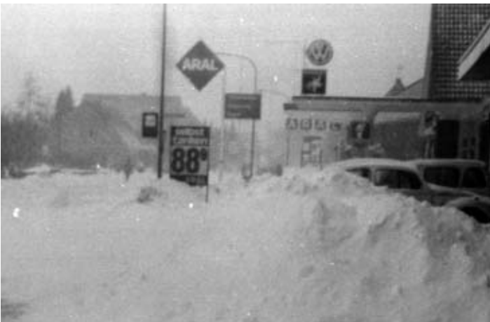
Remels, Standort etwa Uhren/Optik Groth