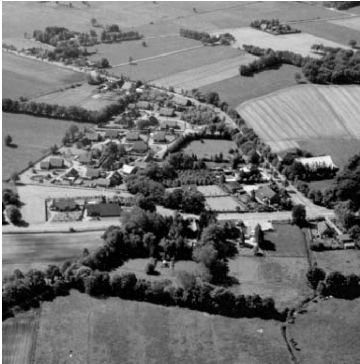
Das „neue“ Selverde aus der Vogelperspektive. Im Vordergrund die L24 aus nördlicher Richtung fotografiert. Im Hintergrund das Neubaugebiet „Am Poller“.

steinzeitlicher Jäger und Fischer. Im 9./10. Jahrhundert wird Selverde (Seluuida) in dem vom Friesenmissionar Liudger gegründeten Kloster Werden bei Essen erwähnt. Demnach kann Selverde auf eine mehr als tausendjährige Geschichte zurückblicken. Nach dieser frühen Erwähnung vergehen 500 Jahre, bis wieder urkundliche Belege vorhanden sind. Im ältesten Kirchenrech-