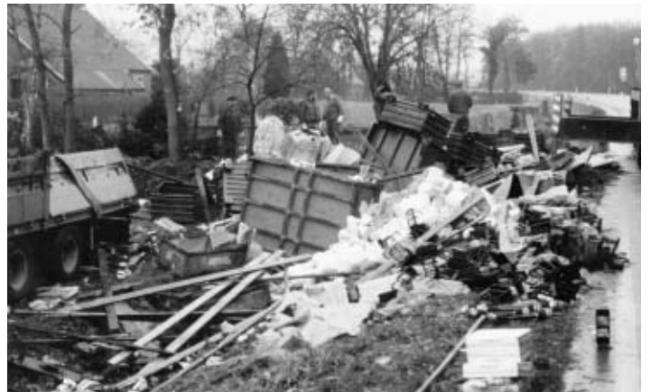
November 1990: Viele Tausend Einzelteile überziehen nach einem LKW-Unfall die Bundesstraße.

Es gibt bestimmt noch viel mehr über diese, wahrscheinlich älteste Ortschaft der Gemeinde Uplengen, zu berichten. Eine Ortschronik ist jedoch leider (noch) nicht vorhanden.