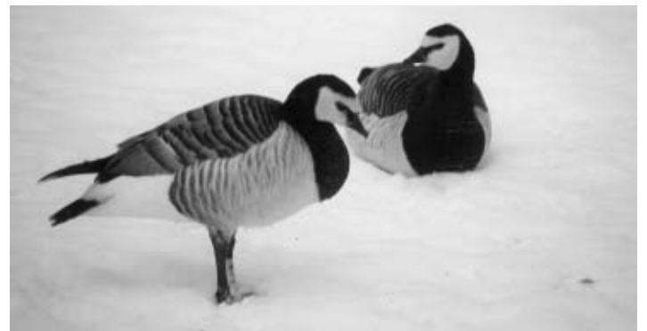
Wesentlich problematischer stellt sich die Nahrungsaufnahme für die arktischen Gänse dar. Unter den Wildgänsen sind es insbesondere die Weißwangengänse, die sich für ihren langen Rückflug in ihre Brutgebiete ein Fettpolster anfressen müssen.