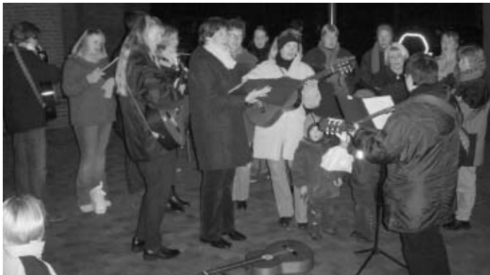
Feierlich untermalt wurde dieser gemütliche Abend für die ganze Familie vom Gitarrenchor Hollen und vom Posaunenchor Hollen.