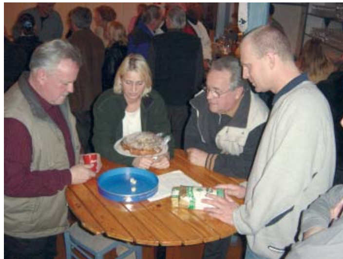
Im Gasthof „Zur Post“ hatte das Glücksspiel Hochkonjunktur.

Auch in Hollen ging es am 5. Dezember wieder „um die Wurst“