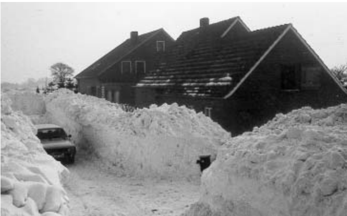
Hollsand, Fam. Pollmann und Fam. Eujen/Schwarz