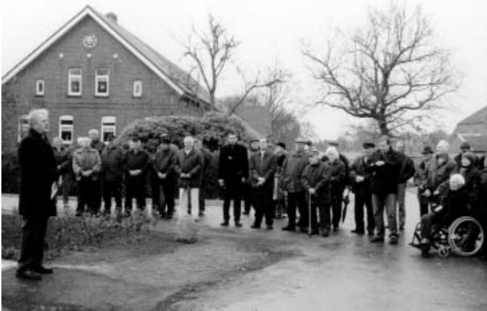
Feierliche Einweihung mit dem Bürgermeister.

Hunderte Arbeitsstunden / Kranzniederlegung